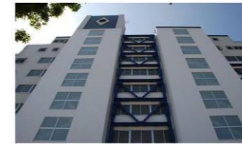
マンションの耐震改修工事の例