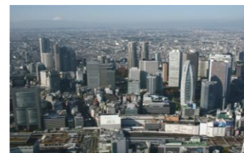
まちづくりが進む新宿駅周辺