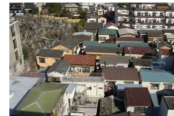
共同化前の木造住宅密集地域