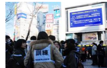
滞留者対策訓練の様子