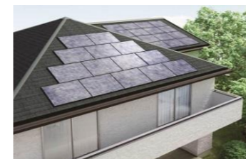
太陽光パネルの設置（イメージ）