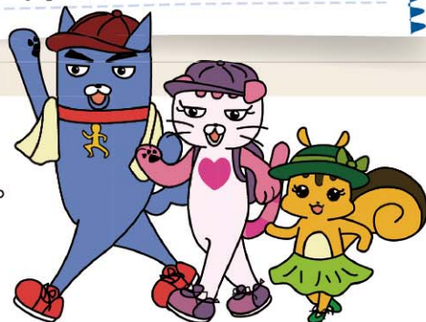
しんじゆく健康フレンズ

ひとりで気ままに、ご家族やお友達と一緒に、太陽を浴び、五感に刺激を受け、楽しいウォーキングの時間を習慣にしませんか。