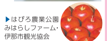
▶はびる農業公園 みはらしファーム・伊那市観光協会