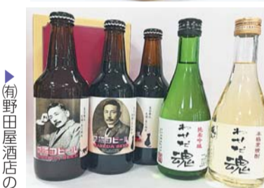
▶(有)野田屋酒店のビールほか