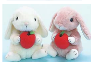
▶(株)スターチャイルドのぬいぐるみ