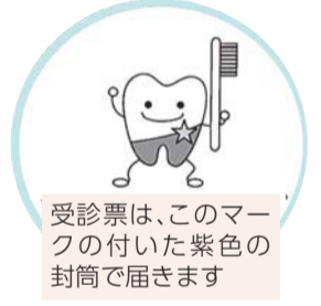
受診票は、このマークの付いた紫色の封筒で届きます

区内在住の3歳~6歳児は、区の協力医療機関で年2回、無料で健康チェック(歯科健診)と、歯の質を強くし、むし歯になりにくくする効果のあるフッ素の塗布を受けられます。対象の方には、4月末に区から受診票(2回分)を発送しています。受診票がお手元でない方は、健康づくり課健康づくり推進係へご連絡ください。