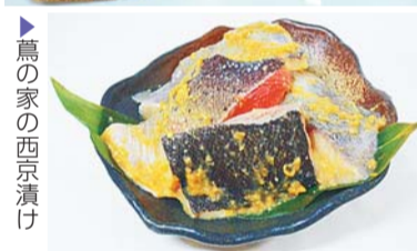
▶鳥の家の西京漬け