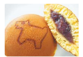
▶(株)文明堂東京・新宿観光振興協会