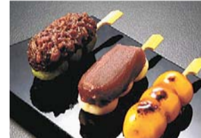
▶(株)追分だんご本舗

新宿の観光をPRする冊子を配布するほか、映像や写真で区の観光情報を発信します。また、新宿を代表する老舗の商品や、友好提携都市「信州・伊那市」の特産品を展示・販売します。