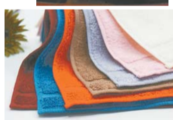
▶(株)ライフリングの消臭タオル