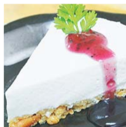
◀こだわりのスイーツ & レアチーズケーキ