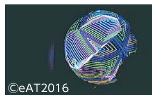
代表作品「sphere installation for eAT2016 in KANAZAWA」

【アーティスト】superSymmetry(デジタルアーティストのユニット) 【放映ビジョン】エストビジョン(新宿3-38-1)、フラッグスサイネージ(新宿3-37-1)