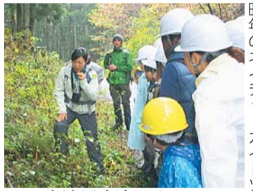
昨年のネイチャーガイドツアー

森林整備体験等を通して、地球温暖化対策の取り組みを学びませんか。参加者には、省エネ活動に取り組む「新宿エコ隊」に登録していただきます。 【日程】11月18日(土) 【対象】区内在住の小学生以上(小・中学生は保護者同伴)、40名 【内容】森林整備体験、ネイチャーガイドツアー、交流昼食会ほか 【費用】無料(温泉入浴料900円程度(希望者のみ)は自己負担) 【申込み】9月29日(金)までにはがき(必着)・ファックス(4面記入例のほか参加者全員の氏名・性別、小・中学生は学年を記入)または直接、環境対策課環境計画係(〒160-8484歌舞伎町1-4-1、本庁舎7階) ☎(5273)3763・☎(5273)4070へ。応募者多数の場合は初めて参加する方を優先して抽選し、結果は10月6日(金)までに応募者全員に発送します。