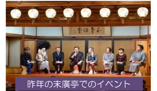
昨年の末廣亭でのイベント