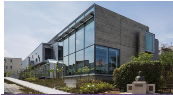
会場の漱石山房記念館(9月24日開館)