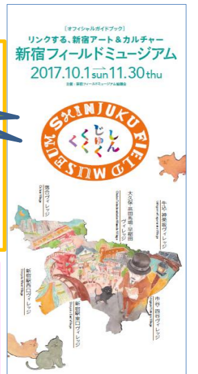
(公式ガイドブックイメージ)

詳細は、公式ガイドブック、専用ホームページをご覧ください。(ガイドブックは9月下旬から配布予定)