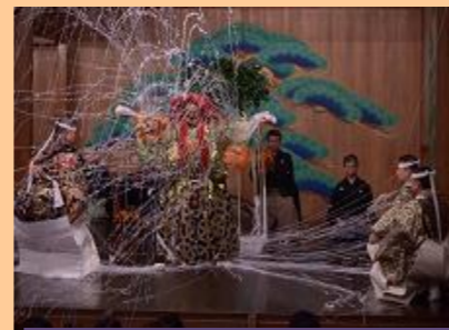
矢来能楽堂 能や狂言の公演