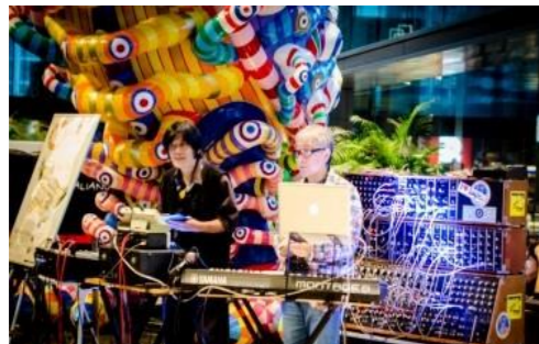
昨年のアート展示会場でのイベント