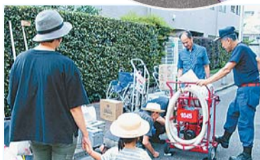
▲消防団員によるポンプの操作説明

いざというときのため、消防団員が火災時のポンプの使用方法について実演を交えながら説明しました。