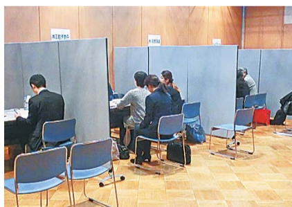
▲昨年の商談会の様子