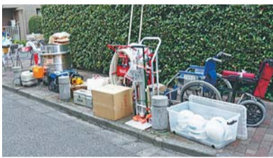
▲町会倉庫の備蓄品の展示