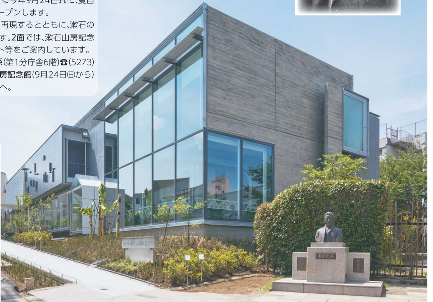
▶記念館の中にかつての「漱石山房」の書斎・客間・ベランダ式回廊を再現

【問合せ】▶文化観光課文化資源係(第1分庁舎6階)☎(5273)4126・☎(3209)1500、▶漱石山房記念館(9月24日(日)から)☎(3205)0209・☎(3205)0211へ。