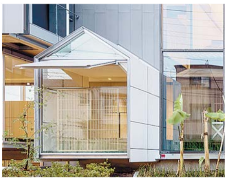
▲建物外観の一部はかつての「漱石山房」の玄関をイメージ