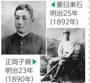
夏目漱石 明治25年(1892年)

【日時】▶特別展…9月24日(日)～11月19日(日)午前9時30分～午後5時30分(入館は午後5時まで。土曜日は午後1時から学芸員による解説あり(30分)。10月10日(火)・23日(月)、11月13日(月)は休館)▶物産販売…9月24日(日)～26日(火)午前10時～午後3時 【費用】300円(新宿歴史博物館常設展とのセット券は500円。中学生までは無料) 【会場・問合せ】新宿歴史博物館(三栄町22) ☎(3359)2131へ。