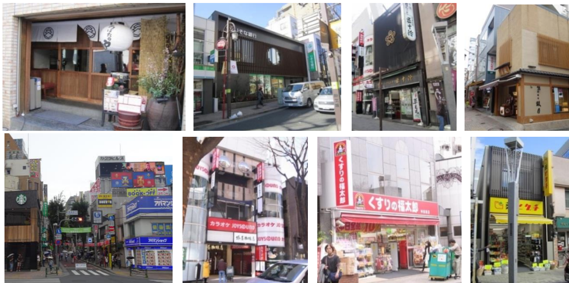
神楽坂周辺に掲出された屋外広告物

このような現状を受け、地域住民（神楽坂まちづくり興隆会）から、神楽坂の景観にふさわしい屋外広告物のルール化を求める要望書が新宿区に提出された。そのため、地域の特性に基づく屋外広告物の景観誘導の方策として、屋外広告物に関する地域別景観形成ガイドライン（神楽坂地区）の策定に向けた取り組みを平成 29 年度から開始した。