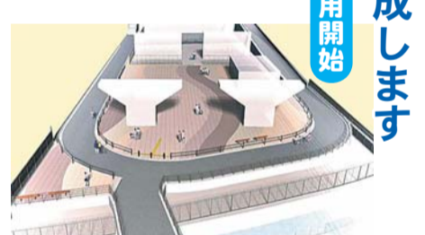
▲南側広場・人道橋完成イメージ