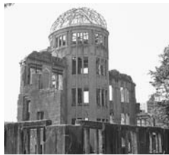
原爆ドーム(広島市)

平和の尊さと戦争の悲惨さについて学び、平和への意識を高めていただくため、次代を担う子どもたちと保護者(7組14名)を、広島と長崎へ隔年で派遣しています。