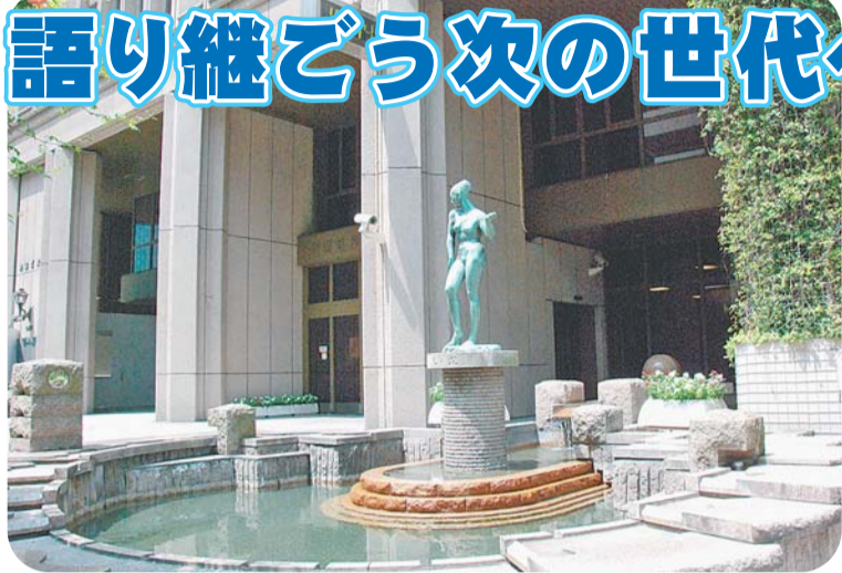
区役所本庁舎前の平和の泉・平和祈念像