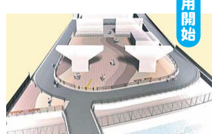
▲南側広場・人道橋完成イメージ