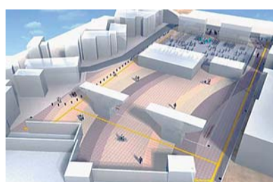
▲北側広場・駐輪場完成イメージ

南北広場は8月26日から利用開始 西武新宿線中井駅周辺の利便性向上のために進めてきた環状6号線(山手通り)中井富士見橋高架下を活用した駅前広場等の整備工事がまもなく完了します。各施設の利用開始日は次のとおりです。