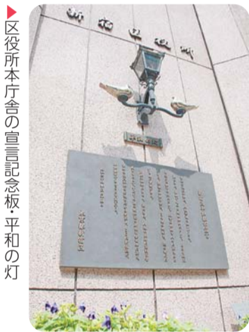
区役所本庁舎の宣言記念板平和の灯

【問合せ】総務課総務係(本庁舎3階)☎(5273)3505・☎(3209)9947へ。