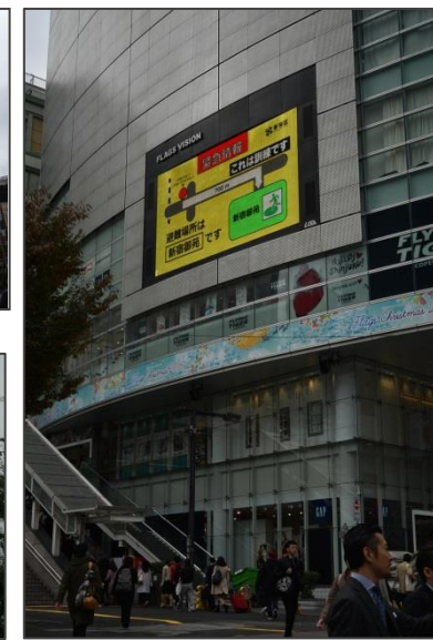
フラッグスビジョン