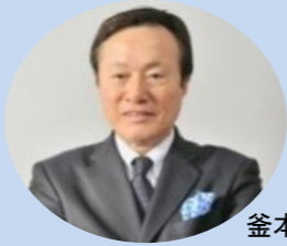
釜本邦茂氏 メキシコ1968オリンピック サッカー銅メダリスト