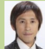
梶原雄太(キングコング)