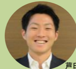
芦田創氏 リオ2016パラリンピック パラ陸上競技 4×100mリレー 銅メダリスト