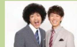
トータルテンボス