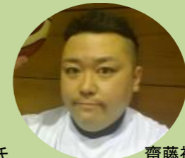
齋藤祐介氏 車椅子バスケットボール選手