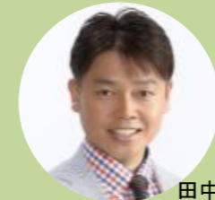
田中光氏 アトランタ1996オリンピック 体操競技 日本代表