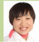
しずちゃん(南海キャンディーズ)