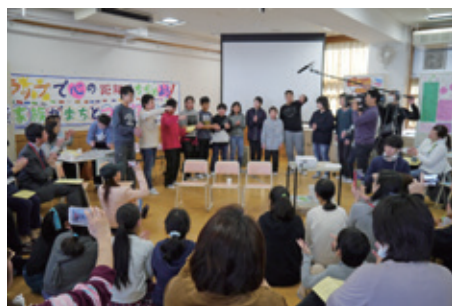
▲まちへの想いをラップで表現

最後は「つながろう大久保」のキーワードをそれぞれ保護者の母語に訳して加え、参加者全員で歌いました。歌い終わると拍手と歓声が湧きおこり、会場全体が大きな一体感に包まれました。