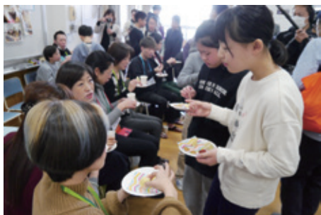
▲保護者、地域の方たちと楽しくフリートーク

2月20日(火)、大久保小学校の6年生が保護者や地域の方々を招き、「ラップで心の距離をちぢめよう！一家族がまちとつながるためにー」をテーマにした交流会を開きました。