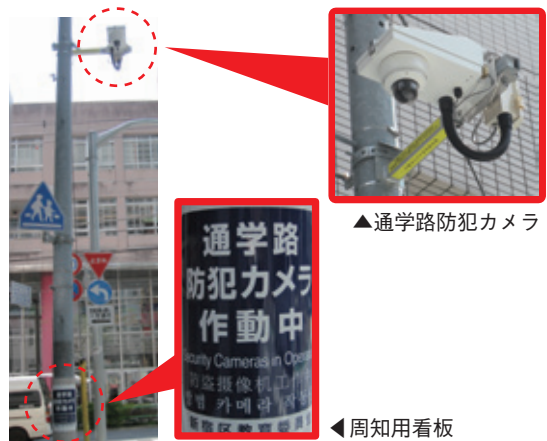
▲通学路防犯カメラ