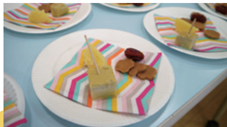
▲子どもたちが真心込めてつくった外国のおやつ

「普段外国の方とお話しする機会が少ない。みんなで集まれて本当によかった」「初めて会った方もいたので連絡先を交換したい」という保護者の声や、「交流会が成功して嬉しい」「これをきっかけに親同士、地域同士でつながってほしい」との子どもたちの感想も聞かれるなど、今日の一体感を次につなげていきたいという参加者の熱い思いが伝わる交流会となりました。