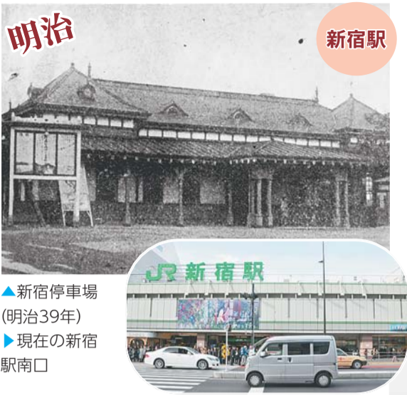
▲新宿停車場(明治39年) ▶現在の新宿駅南口

新宿区は昭和22年(1947年)3月15日に四谷区・牛込区・淀橋区が合併して誕生し、平成29年(2017年)3月15日で区成立70周年を迎えました。今回は、新宿区が誕生する前にもさかのぼり、これまでと現在のまちの風景を追いかけてみました。 【問合せ】区政情報課広報係(本庁舎3階) ☎(5273)4064・FAX(5272)5500へ。