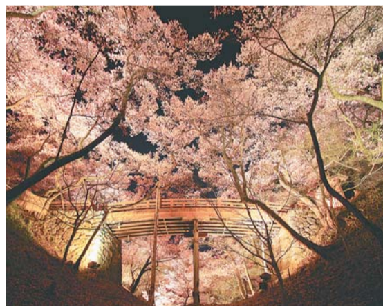
桜雲橋のライトアップ

友好提携都市・長野県伊那市の高遠城址公園は、「日本三大桜名所」の一つです。また、「日本さくら名所100選」にも選ばれ、「天下第一の桜」とも呼ばれています。園内に咲き誇る約千500本の固有種・タカトオコヒガンザクラは、小ぶりであり赤みの強い色が特徴です。 期間中は、高遠ばやしの巡行や各種イベント(左記)も開催されます。日没から午後10時ころまでは桜がライトアップされ、夜桜の幻想的な風景が広がります。 ●イベント情報 ▼アルクマ熱気球体験(左写真):4月5日(水)7日(金)、10日(日)14日(金)午前8時～8時30分に受け付け(1名2千400円、6～11歳千800円、2～5歳500円。11歳以下は保護者同伴) ▼江戸かつぼれ:4月7日(金)午前11時から午後1時30分(雨天中止) ▼伊那のうまいもん大集合(ローメン、ソイスかつ井、伊那餃子、そばガレット)の販売:4月8日(土)16日(日)午前10時から