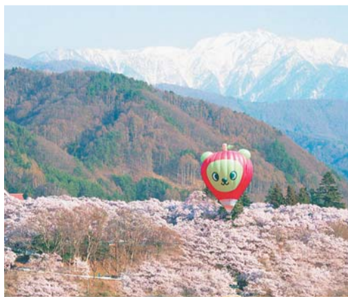
高遠城址公園の桜と南アルプス