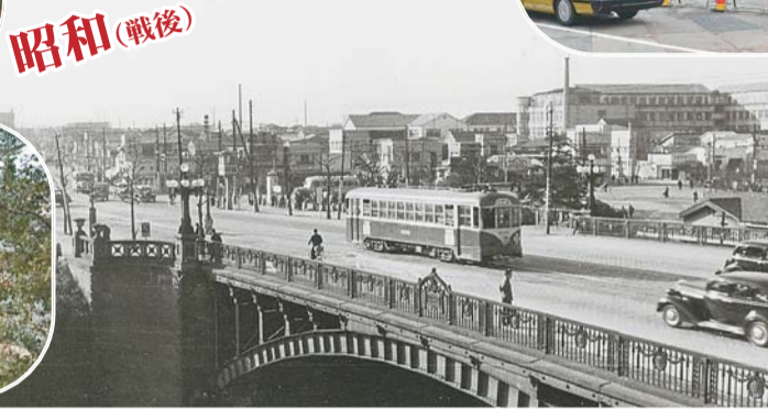
▲大正2年に完成した初代の四谷見附橋(昭和25年ごろ)