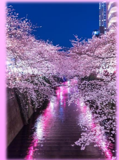
【参考】ライトアップイメージ