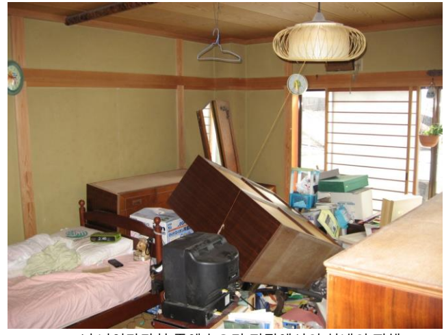
2007년 니이가타현 주에츠오키 지진에서의 실내의 피해