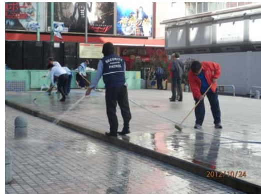
② シネシティ広場の清掃