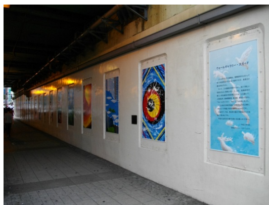
平成 23 年 9 月 北側に設置した壁画