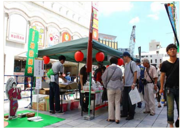
岐阜県地歌舞伎の上演と観光・特産品 PR (歌舞伎町初の歌舞伎町公演)