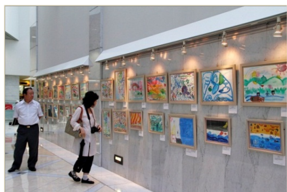
東日本大震災で被災した子どもたちが絵の展覧会 （ハイジア）