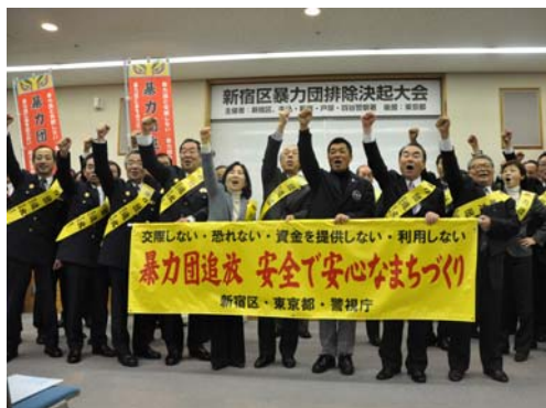
新宿区暴力団排除決起大会と安全安心まちづくりパレード