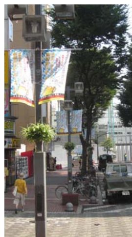
新宿オクトーバーフェストの広告掲出