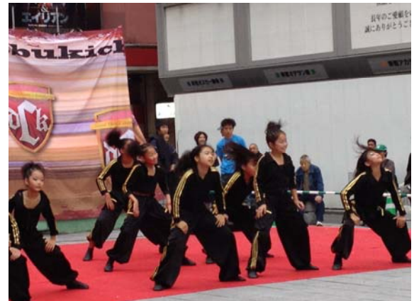
歌舞伎町ダンスコンテスト