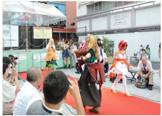
ファッションショー (シネシティ広場)