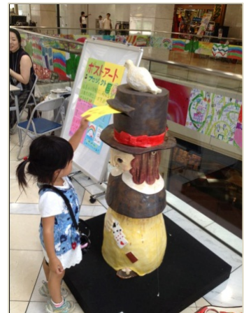
ポスト形アート作品の展示（ハイジア）