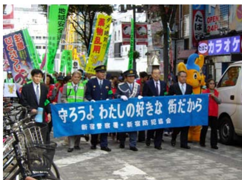
安全・安心啓発キャンペーン