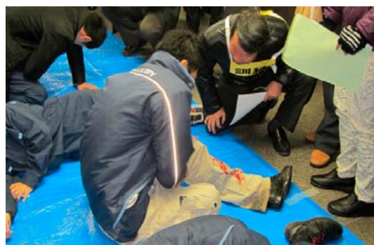
新宿駅周辺防災対策協議会防災訓練