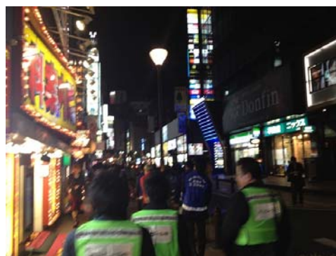
安全・安心パトロール