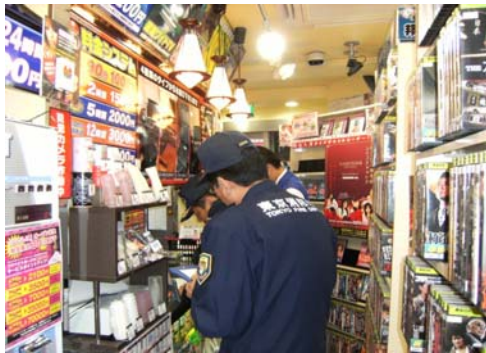
雑居ビルへの立入検査