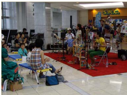
親子で楽しむ音楽イベント （ハイジア）