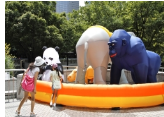
著名アーティストの特別展 (新宿西口高層ビル街等)