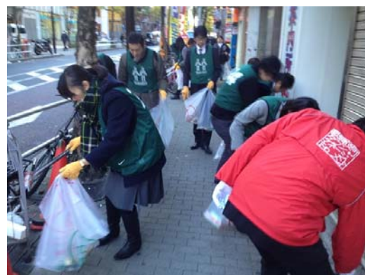
④ 企業、NPO、社会福祉施設利用者によるコラボ清掃活動