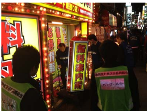
③ 不法看板の是正指導