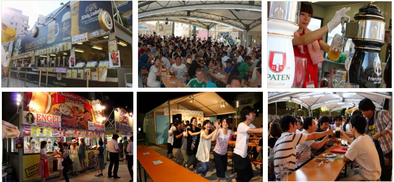
新宿オクトーバーフェスト 2012

大久保公園では、国際交流、地方物産の紹介・販売、スポーツなど様々なイベントを開催しています。