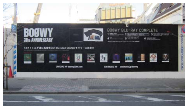
人気ロックバンド「BOOWY」30周年記念 ブルーレイ・ディスク&CDボックスの広告掲出