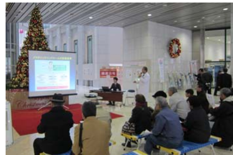
サロンコンサート & 健康講座