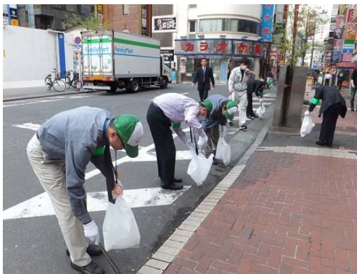
① 歌舞伎町クリーン作戦