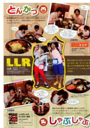
グルメ情報の取材をした吉本興業のお笑い芸人・LLR