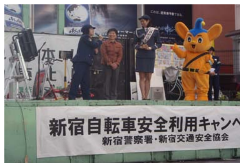
自転車安全利用キャンペーン