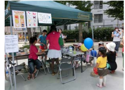
アート作品の展示・販売、実演 (大久保公園)