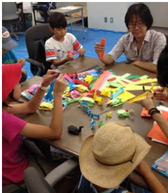
親子で楽しめるアート体験教室（ハイジア）