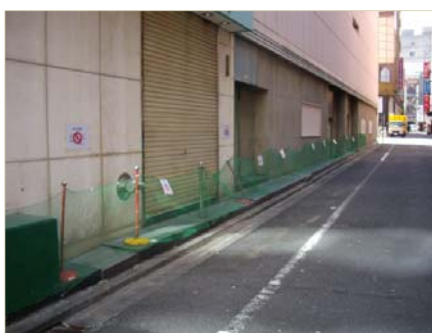
周辺事業者によるネットや柵の設置