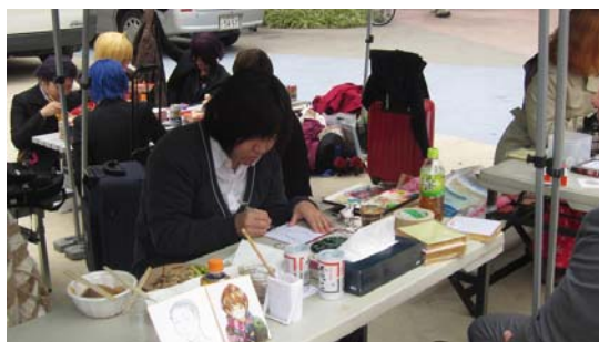
大久保公園のイベントに出展した宝塚大学の学生有志