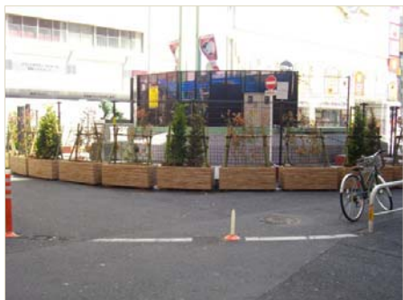
シネシティ広場 柵と植栽の設置