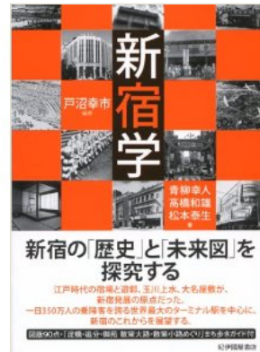
新宿の今昔と未来について、都市計画等様々な視点からわかりやすく解説した「新宿学」の講演会（ハイジア）