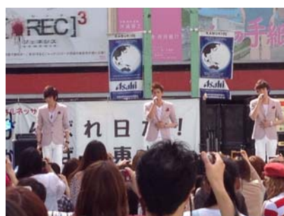
シネシティ広場のイベントに出演するK-POP タレント