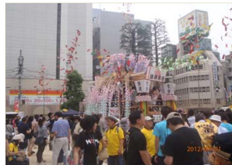
被災地支援イベント（陸前高田市伝統の山車の披露）