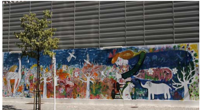
親子で描く大壁画（旧新宿コマ劇場仮囲い）