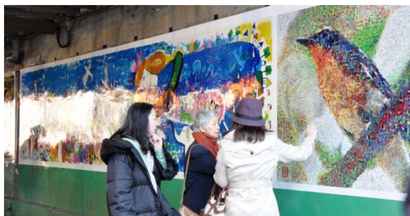
平成 25 年 1 月 南側に設置した壁画 (題名「ママから生まれる命」)

〔協 力〕新宿警察署、東日本旅客鉄道株式会社、NPO 法人 3.11 こども文庫