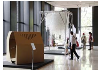
学生の創作したオブジェ等の展示 (新宿モア4番街、新宿西口高層ビル街)