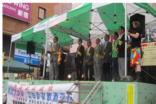
飲酒運転防止キャンペーン