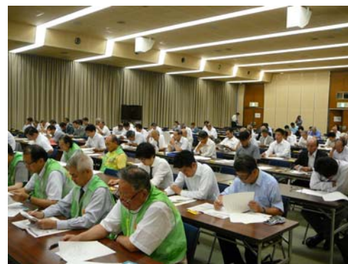
第9回総会（於：株式会社損害保険ジャパン）