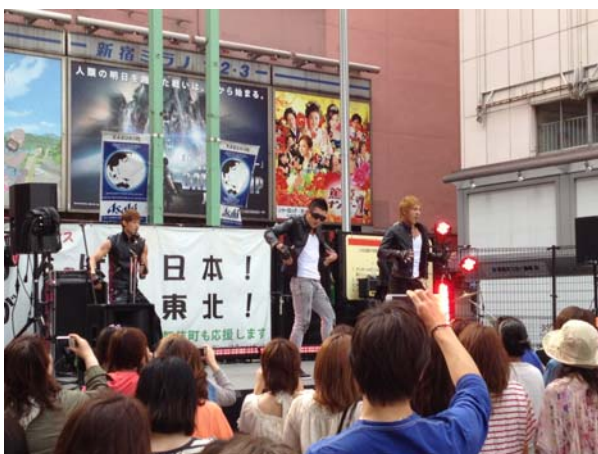
日韓友好交流イベント