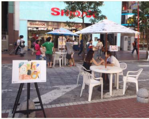
アートを楽しめるオープンカフェ (歌舞伎町セントラルロード)