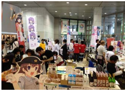
萌え観光物産展（アニメ等でまちおこしに取り組む団体による、観光・特産品PRイベント）