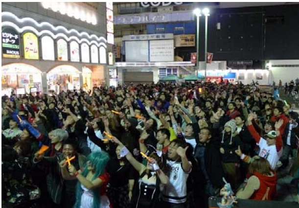
Re:animation[リアニメーション] (屋外クラブイベント)