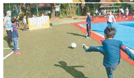
戸塚第一小学校 「おはよう広場」 地域の方々が子どもたちの朝遊びを見守り