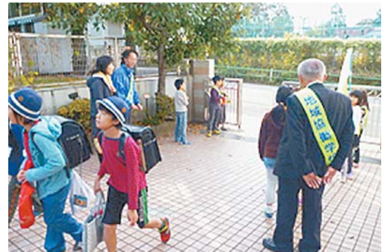
四谷第六小学校 保護者・地域の方々が手作りのタスキをかける朝のあいさつ運動

活動には、協議会委員の皆さんだけでなく、地域の方や保護者もさまざまな形でボランティアとして参加しています。