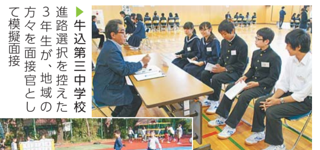
牛込第三中学校 進路選択を控えた3年生が、地域の方々と面接官として模擬面接