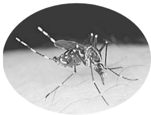
▲ヒトスジシマカ