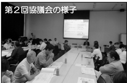
第2回協議会の様子