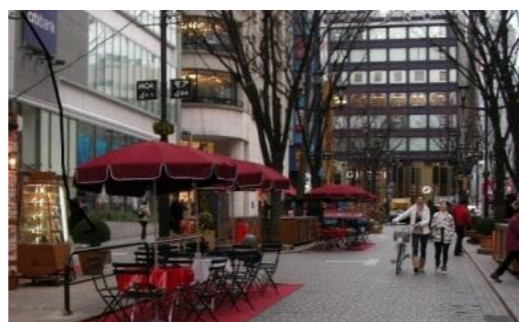
(写真：モール化における1つの参考イメージ 新宿モア4番街におけるオープンカフェの様子)