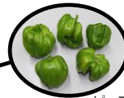
ピーマンにも似ています 「神楽南蛮」