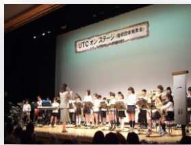
江戸川小児童による演奏