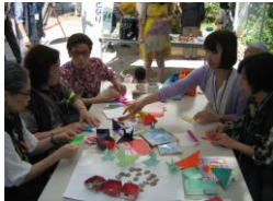
折り紙で色々なものを作ってみました。 鶴や風船の作り方覚えていますか？