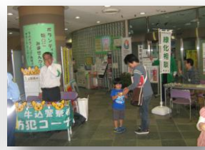
緑化相談・防犯コーナー