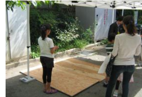
上手にコマを回せるかな？