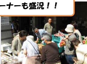
沼田市の野菜販売