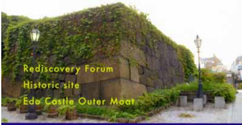
Rediscovery Forum Historic site Edo Castle Outer Moat