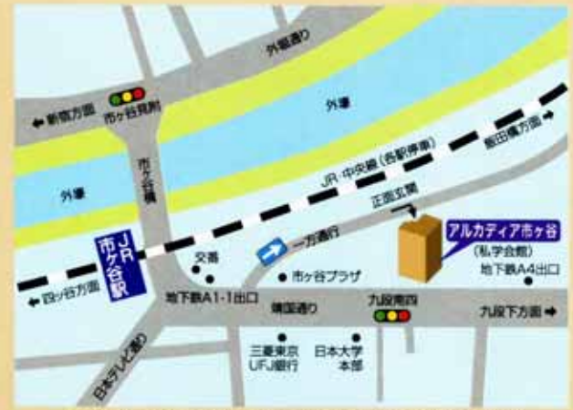
JR線・地下鉄(有楽町線・新宿線・南北線)市ヶ谷駅 徒歩2分

アルカディア市ヶ谷(私学会館)5階「大雪」 (千代田区九段北4-2-25) 電話 03-3261-9921 (代)