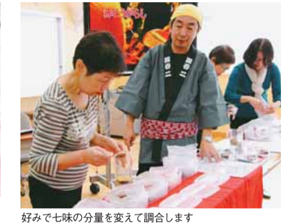
好みで七味の分量を変えて調合します

この日は、四谷中学校コミュニティクラブが、収穫したとうがらしを使って「内藤七色とうがらし」を調合するワークショップを開催。「混ぜると、とうがらしの香りがより際立ちますね」と、できたての香りを堪能しました。