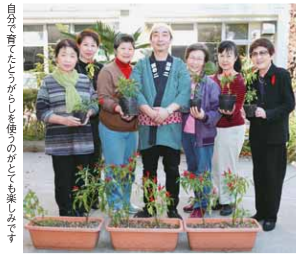
自分で育てたとうがらしを使うのがとても楽しみです