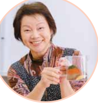
きれいな七色でしょ