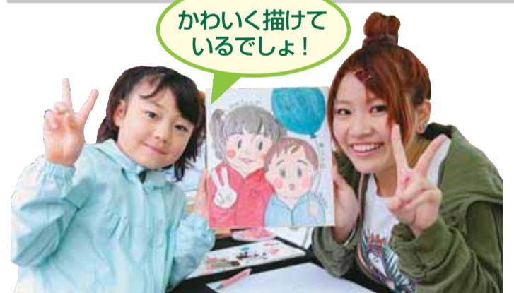
かわいく描けているでしょ!