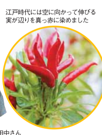
江戸時代には空に向かって伸びる実が辺りを真っ赤に染めました