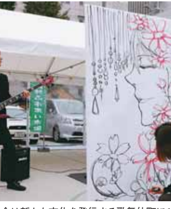
絵と音楽の融合は新たな文化を発信する歌舞伎町にぴったり