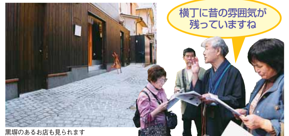
横丁に昔の雰囲気が残っていますね

録文化財の意義などを広く紹介。登録文化財を巡るまち歩きには、約70名の方が参加しました。まちを大切に思う心が、神楽坂のさらなる魅力の発信につながっています。