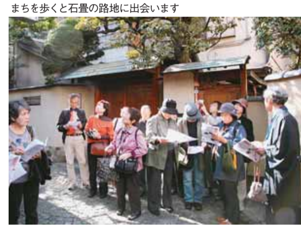
まちを歩くと石畳の路地に出会います

散策を楽しむ人が思い思いに行き交う神楽坂。昔ながらの建物や趣のある路地が、古き良きまちの風情を残しています。こ