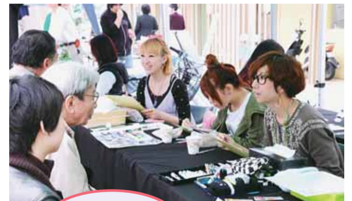
家族の記念になりました