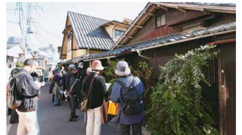
「素敵な建物ですね。また訪ねたい」ガイドの案内で文化財を巡ります

取り組みの一つが、区と協働で実施した「神楽坂の地域資産を登録文化財として表彰・保全する事業」。この成果として、昨年7月には、4件の建築物が国登録有形文化財に登録されました(写真左)。また、10月に開催したシンポジウムでは、登