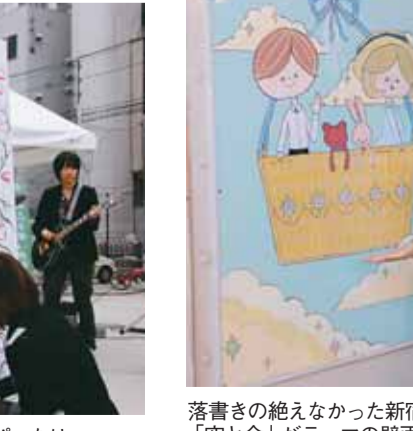
落書きの絶えなかった新宿ガードに「空と命」がテーマの壁画も描きました

触れ合う絶好の機会ですね」と、笑顔で話してくれました。バンドの演奏に合わせて即興で絵を描く「ライブペイント」も披露。音楽に合わせてリズムカルに絵を描く姿に、会場は大きな拍手に包まれました。