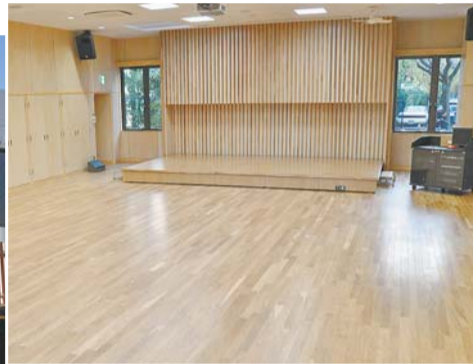
▲ステージを使った発表会も楽しめる多目的ホール