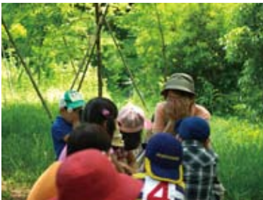
心とからだでのびのび 自然とあそぼう、ふれあおう