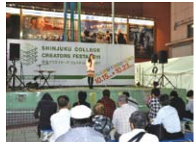
TOKYO BOOT UP! 2011