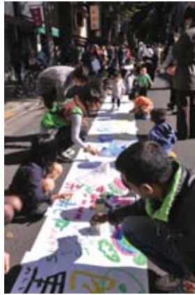
神楽坂まち飛びフェスタ 2011 坂にお絵かき ～ 700m の坂道がキャンパスになる日！