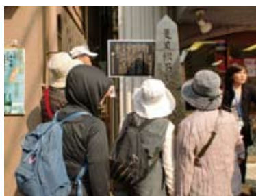
新宿まち歩きガイドツアー 文豪 漱石の足跡を訪ねて