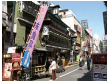
特別興行 末廣亭 余一会