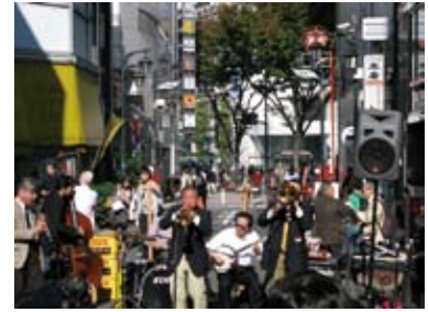
新宿文化ロード トラッド・ジャズ・フェスティバル in ハレクラニ