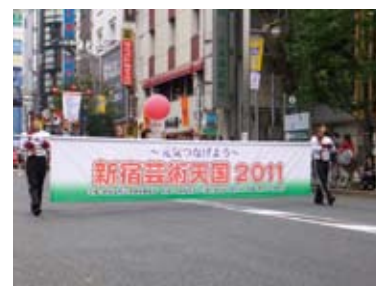
～元気つなげよう～ 新宿芸術天国 2011