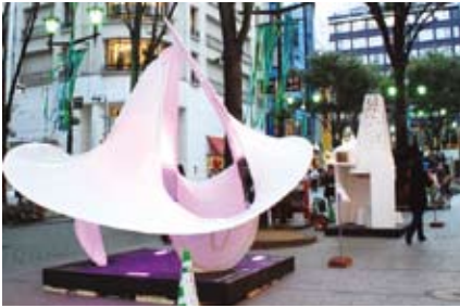
学生クリエイターズ・フェスタ in 新宿 2011