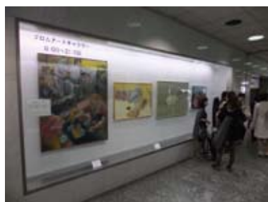
東京都立総合芸術高等学校 新宿ブロードナード展覧会