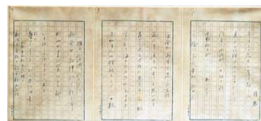
▲芥川龍之介の草稿

同館では、区民の方をはじめ新宿区ゆかりの皆さんから寄贈された数多くの資料を収蔵しています。今回は、近年寄贈された資料の中から、職人の技を伝える「鏝絵(こてえ)」や新宿の伝統工芸「染色」、作家・芥川龍之介の草稿や画家・里見勝蔵の油彩画などの芸術家関連資料等、未来に託したい貴重な資料を展示します。 【日時】4月28日(土)～6月10日(日)午前9時30分～午後5時30分(入館は午後5時まで。5月14日(月)・28日(月)は休館) 【会場・問合せ】同館(三栄町22) ☎(3359)2131・☎(3359)5036へ。