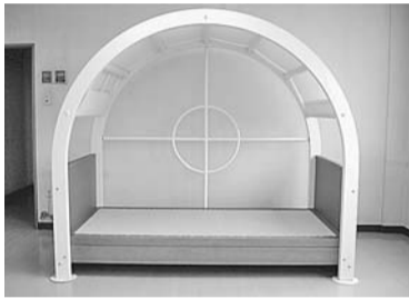
実際に触って強度を確かめてみてください