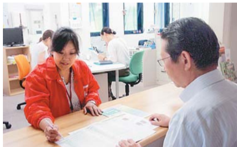
専門職のスタッフが支援します