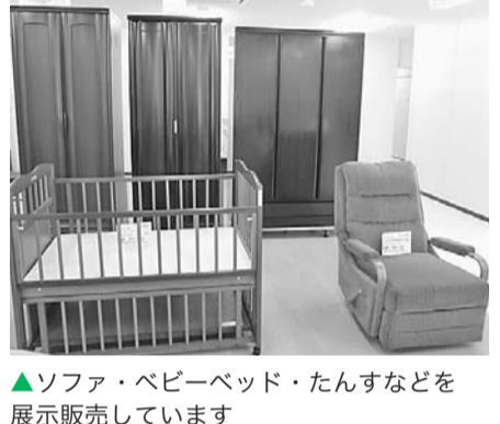
▲ソファ・ベビーベッド・たんすなどを展示販売しています

★大型家具の回収 家庭で不用になった大型家具を無料で引き取り、清掃・修理してから販売します。家具の引き取りを希望する方は、事前にご相談ください。 ★講座・フリーマーケット 「打ち合わせスペース」は、環境・リサイクル関連の各種講座・講習会などに利用できます。毎月第2・第4土曜日午前11時〜午後2時には、フリーマーケットを開催します(6月は26日)。