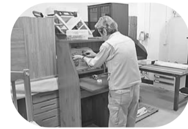
回収した家具は作業室で清掃・修理します

戸塚小売市場の跡地に、5月1日にオープンしました。 ★リユース家具等の展示販売 新宿リサイクル活動センターで行っていたリユース(再利用)家具等の展示販売を実施しています。持ち運びができない品物や電気製品等の情報は「大型目録コーナー」でご覧いただけます。