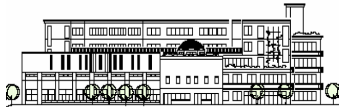
北側(都営住宅側)から見たイメージ立面図