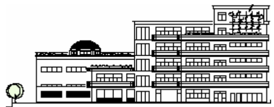
西側(西戸山小側)から見たイメージ立面図