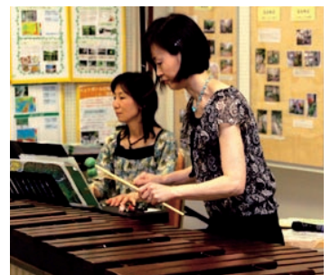
ランチタイムコンサート♪マリンバ演奏