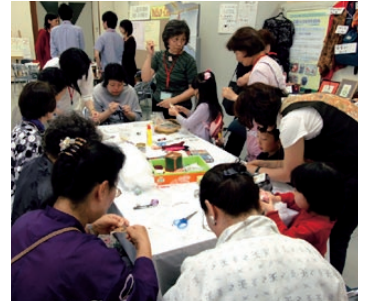
古布からふくろうのストラップづくり