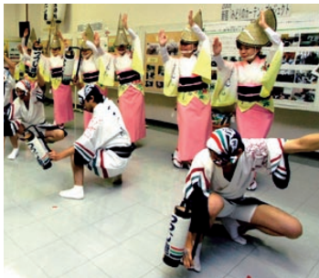
つつじ連の阿波踊り