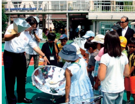
親子で楽しいぞろり作り♪はかって何度?を体験してビックリ!! 太陽の熱で調理するソーラークッカーにワクワク...夏休みはドキドキワクワクのエコにトライしよう!

●「エコにトライ!」は、7月21日(火)～8月23日(日)まで開催しています。楽しいイベントの一部を紹介しましょう。