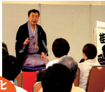
エコ落語 桂歌若師匠