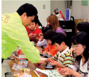
ソーラーカー工作