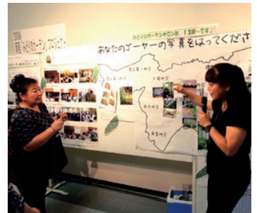
みどりのカーテンサロン