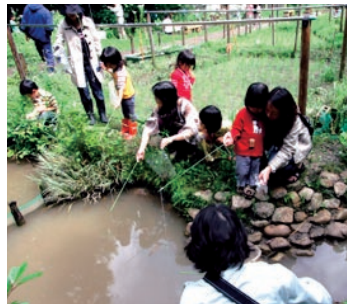
楽しいザリガニ釣り♪