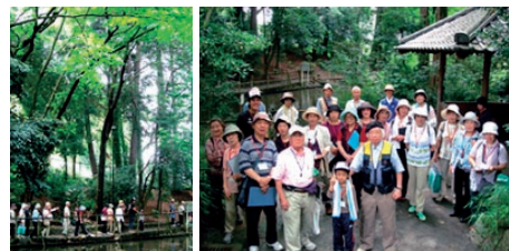
(写真上) 5月3日、新緑と花の哲学堂公園。(写真下) 7月4日、都心の森「おとめ山公園」。案内人のお話を聞きながらミニハイキングを楽しみました!