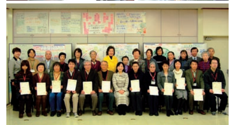
楽しくワークショップに取り組みながら、ペットボトルなどのリサイクル資源の行方を追って施設見学も行いました。修了式は中山区長と一緒に記念撮影です。