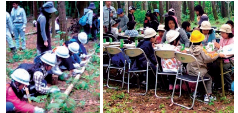
5月30日、「新宿の森」オープニングイベントを開催! 子ども達は地元の人に指導を受けながら間伐を体験。交流野外昼食会では地元のご馳走をいただきました♪

●天ぶら油リサイクルバスで行く さわやか信州・伊那「新宿の森」づくり体験「カーボンオフセットエコツアー」