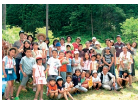
私達みんなが田植えをしました!

現在、稲の成長を見守っています。稲穂の実り具合を見て、稲刈りの日程を決定します。ホームページやチラシ、また次号でも詳しくお知らせいたしますので、もうしばらくお待ちください。