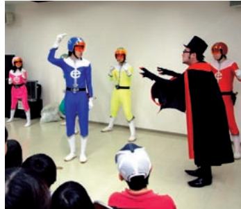
新宿エコレンジャーショー