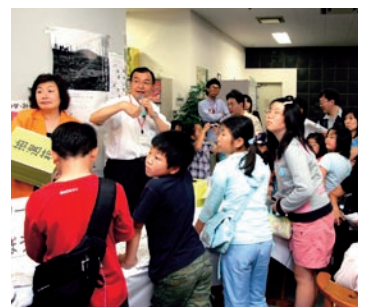
お楽しみの抽選会で賞品をゲット!