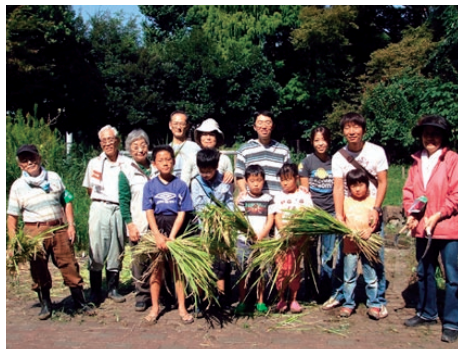
(写真上) 6月7日の田植え体験。この日はどんなに泥んこになってもOK! (写真下: 昨年度の収穫) 小さい苗はどんどん成長して、秋にはこんなに大きくなります。