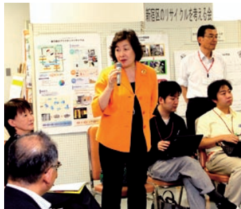
いわせて・きかせてエコライフ YOU & ME