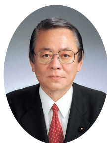
自由民主党 新宿区議会議員団