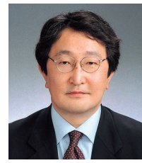
20 のづ たけし

〒162-0062 市谷加賀町2-6-1 市ヶ谷加賀町アパート D-302 (3260) 1456