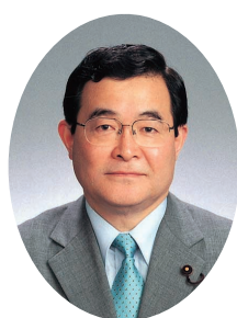
新宿区議会 無所属クラブ