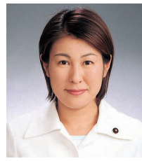
21 あざみ 民栄

〒162-0062 市谷加賀町2-6-1 市ヶ谷加賀町アパート D-302 (3260) 1456