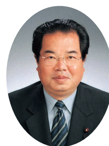
日本共産党 新宿区議会議員団