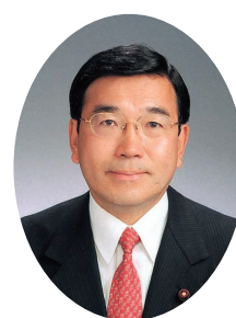
新宿区議会 公明 明 党