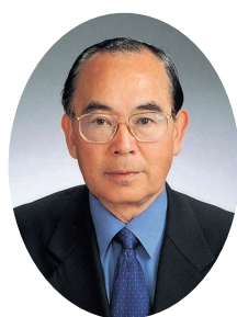
民主党 新宿区議会議員団