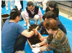
土のリサイクル講座で土づくり