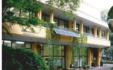
エコギャラリー新宿の建物は、太陽や風・植物など自然の力を利用したエネルギーを活かし、省エネに取り組んでいます。