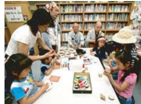
木のペンダントづくり♪