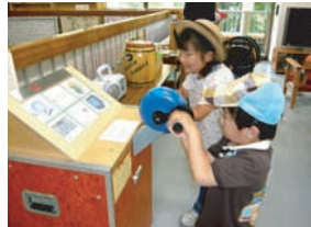
エネルギーハンドルで発電体験!

それでは私も、まずは身近なところから…本庁7階の環境対策課まで階段で行くとしましょう。