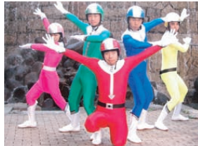
私たちのヒーロー「エコレンジャー」