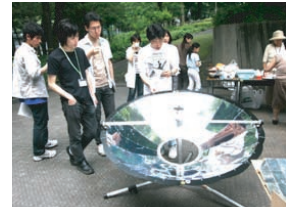
ソーラークッカーを活用したエコカフェ