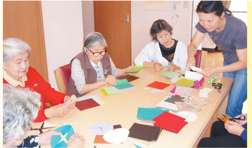
小規模多機能型居宅介護事業所の通いサービスの様子

介護が必要になっても、できる限り住み慣れた地域での生活が続けられるように、区ではさまざまなサービスの整備を進めています。今回は、地域での生活を支援するために、新たに創設された地域密着型サービスを紹介します。 利用を希望する方は、直接事業所にお問い合わせください。 【問合せ】介護保険課推進係(本庁舎2階) ☎(5273)4596へ。