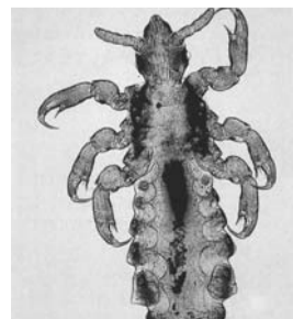
アタマジラミの成虫

シラミは不潔の代名詞のように言われていますが、アタマジラミは、ごく普通の生活をしていても子どもたちが頭を接触させて遊んだり、集団で昼寝をすることや、タオル・ヘアブラシ等の貸し借り等により、人から人へと移動します。また、アタマジラミは毛髪がきちんと洗えていないことにより増えると考えられています。家庭で大人が時々、子どもの頭にシラミがついていないかを調べながら毛髪を洗い、ブラッシングの方法を教えることで予防できます。アタマジラミで病気になることはありません。しかし、頭皮をかき過ぎることで「トビヒ」になる場合があるため、早めに対処しましょう。