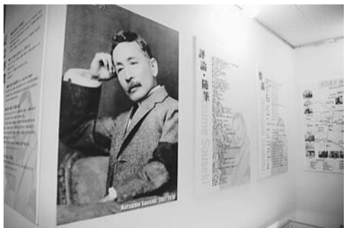
生誕の地、喜久井町で開催された漱石ギャラリー