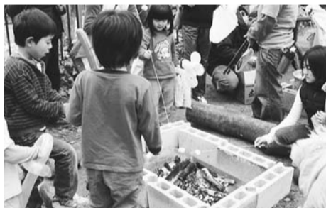
18年度の春祭りの様子

【問合せ】▶新宿中央公園の施設について…土木課施設管理係(本庁舎7階) ☎(5273)3914、▶イベント内容について…子ども家庭課子ども家庭支援係(本庁舎2階) ☎(5273)4544へ。