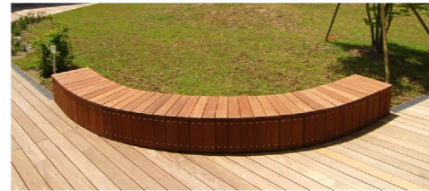
レストコーナーのベンチのイメージ