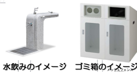
水飲みのイメージ ゴミ箱のイメージ