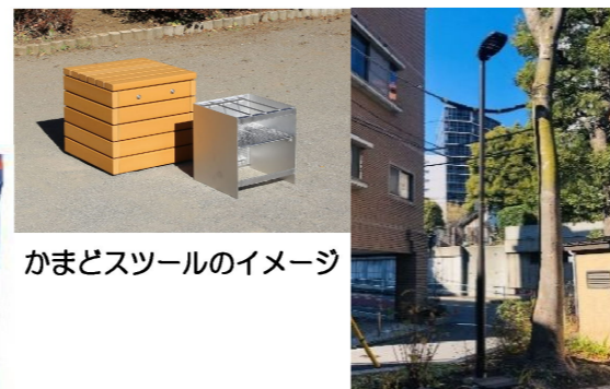
かまどスツールのイメージ