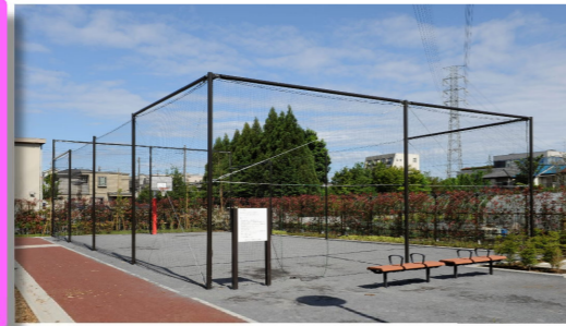
キャッチボールコーナーのイメージ