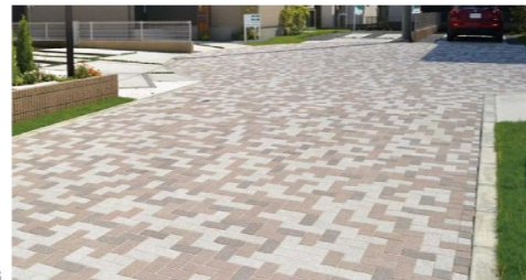
ブロック舗装のイメージ