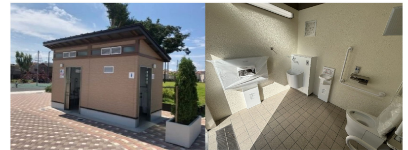
トイレのイメージ