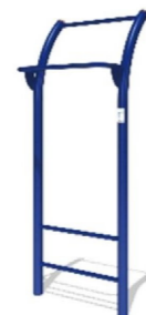
健康器具のイメージ