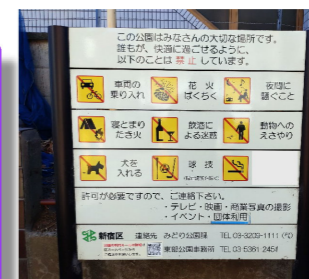
公園内の利用ルールボード