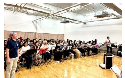
小滝橋ひろば・神楽坂サロン ウクレレ教室『ウクレレ演奏発表会』