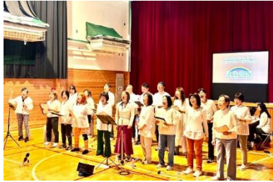
虹色楽団 from おとなのバンド倶楽部 『ライブ・パフォーマンス』