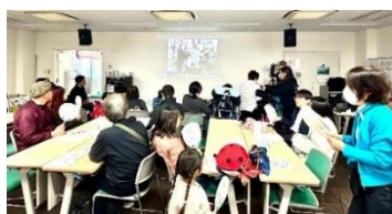
こつこつ 『オンライン・コンサート』