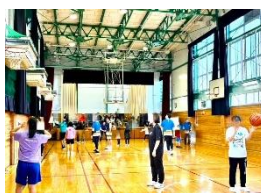
スペシャルオリンピックス日本・東京 『ユニファイドスポーツ体験』