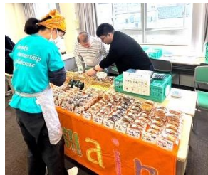
新宿第二あした作業所『デュマン』 （洋菓子の販売）