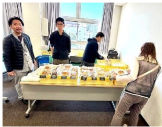
高田馬場福祉作業所『まりそる』 （パンの販売）