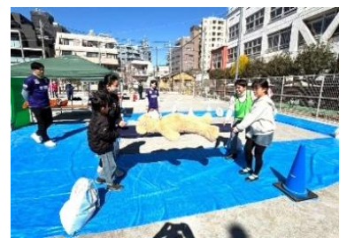
チャリティーサンタ北東京支部 &クリアソン新宿 『アドベンチャーBOUSAIパーク II』