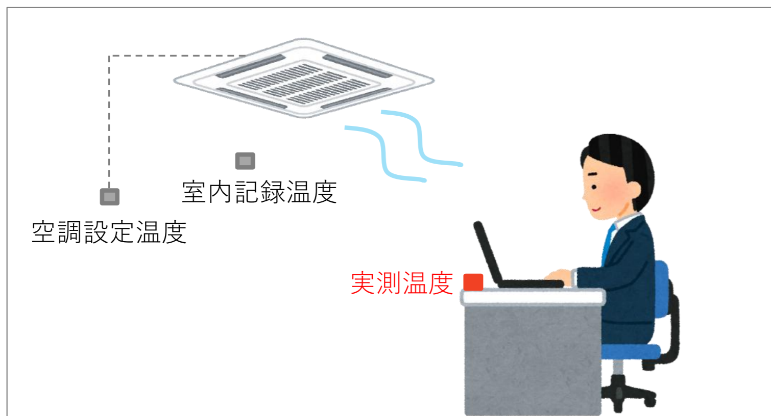
執務室内温度実測の概念図