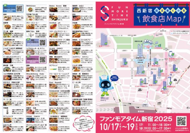
飲食店マップ 配布