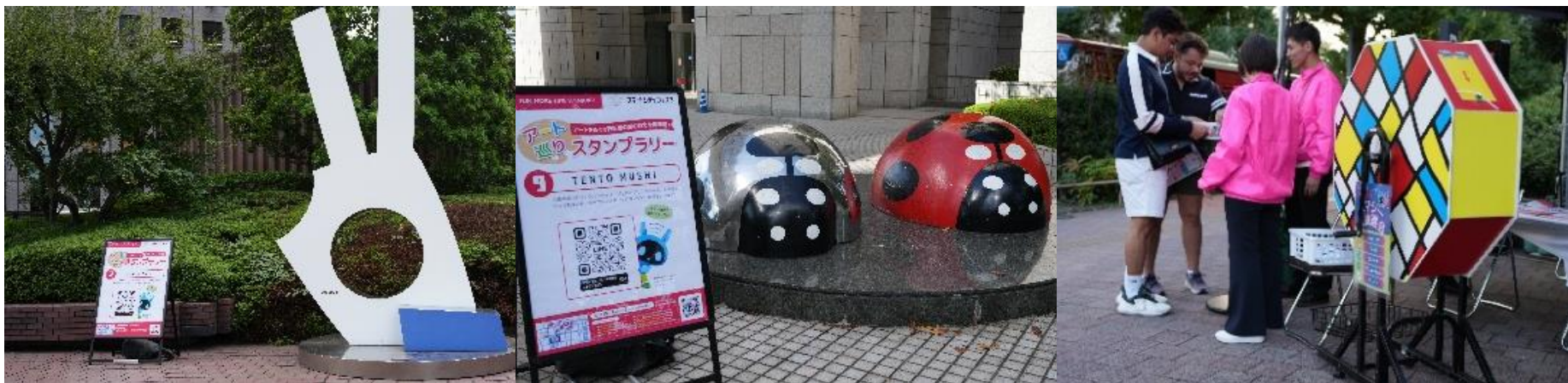
アート巡りスタンプラリー（9か所）