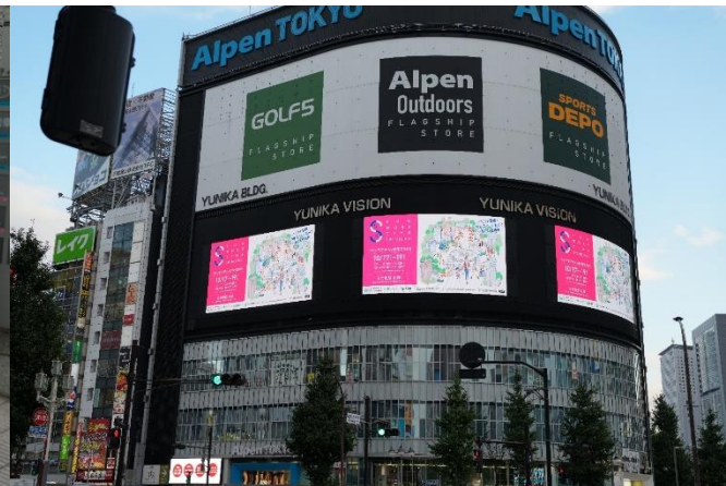
大型ビジョンによる告知