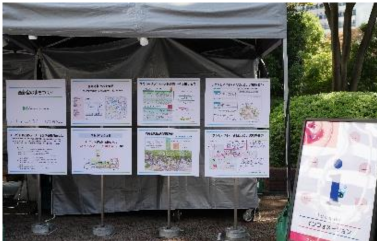
環境改善委員会の取組みPR @総合受付