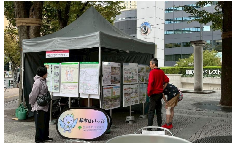
新宿のまちづくりPRブース（東京都） @新宿アイランド