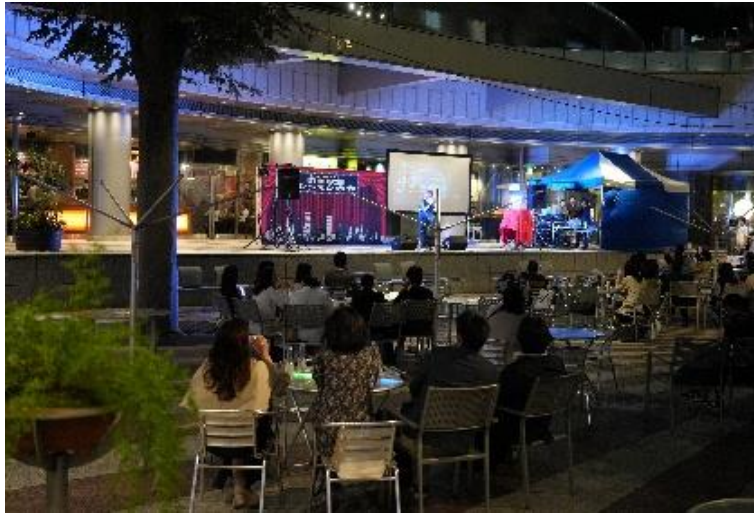
～ファン・モア・ナイト～ @新宿アイランド パティオ広場