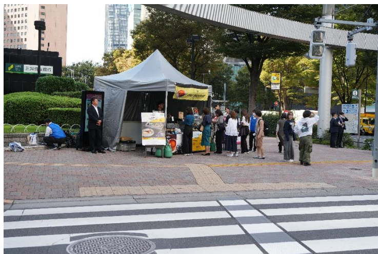
新宿三井ビルディング (歩道占用)