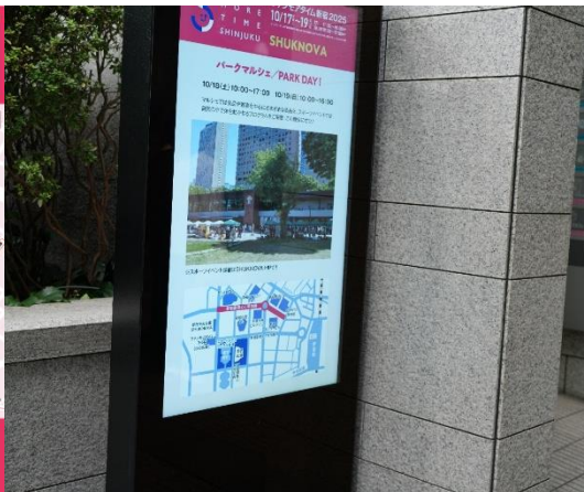
デジタルサイネージ 3台設置