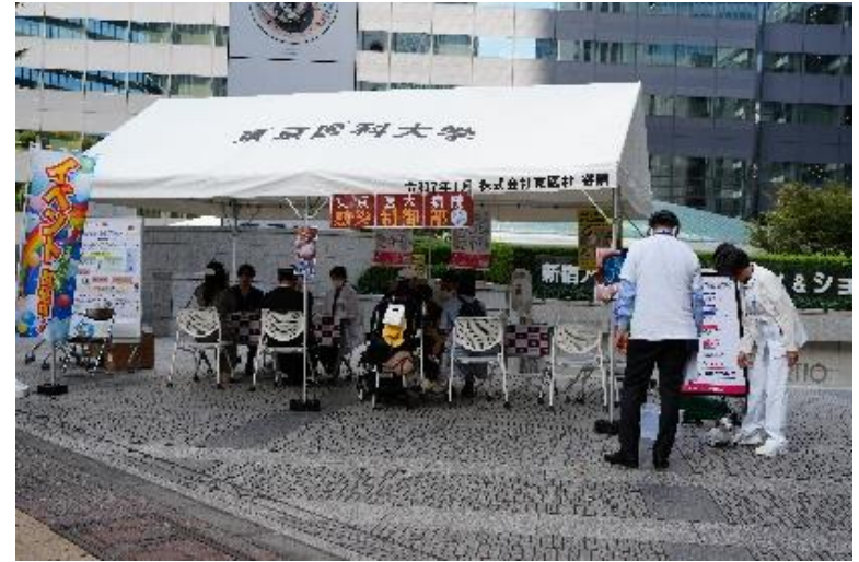
東京医科大学病院 健康情報提供 @新宿アイランド