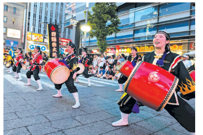
新宿エイサーまつり

8月 8月 新宿中央公園夏まつり=新宿中央公園 同 同園管理事務所。1日 フレッシュ名曲コンサート=新宿文化センター 同 同センター。15日 例大祭=市谷亀岡八幡宮。下旬 例大祭=諏訪神社。