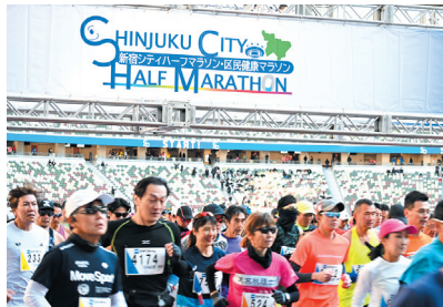
新宿シティハーフマラソン

○弁財天=厳嶋神社○恵比寿=稲荷鬼王神社○福祿寿=永福寺○大黒天=経王寺○毘沙門天=善國寺○布袋尊=太宗寺○寿老人=法善寺。干支祈願=稲荷鬼王神社。七福神まつり=成子天神社。 5日 初弁天祭=厳嶋神社。 8日 湯花神事=花園神社。 12日 はたちのつどい=京王プラザホテル 同 総務課総務係。 13日 おびしゃ祭=葛谷御霊神社、中井御霊神社。 15日・16日 エンマ大王開帳=太宗寺。 18日 牛込簞笥地域まつり=牛込簞笥地域センター 同 同センター。 25日 新宿シティハーフマラソン・区民健康マラソン=MUFGスタジアム(国立競技場)ほか 同 新宿未来創造財団。 28日 円空仏公開(毎月28日午後1時~3時)=中井出世不動堂 同 文化観光課文化資源係