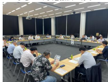
まちづくり勉強会の様子