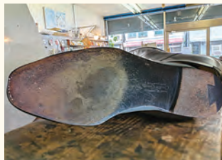
オールソール交換修理前