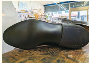
オールソール交換修理後