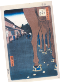
新宿歴史博物館所蔵

問 文化観光課文化資源係(〒160-8484歌舞伎町1-5-1、第1分庁舎6階) ☎(5273)4126・FAX(3209)1500