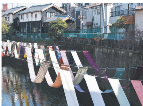
昨年の染の小道(川のギャラリー)の様子

▼2月21日(金)〜23日(祝)の3日間、中井駅周辺で「染の小道2025」が開催されます。妙正寺川に反物を架け渡す「川のギャラリー」や、商店街の軒先をのれんで飾る「道のギャラリー」、染色体験や職人の実演が楽しめる「染のがっこう」等、さまざまなイベント等が開催され、色鮮やかな染め物がまちを彩ります。今年も、最終日に落合・中井地域に縁のある音楽家が集うライブイベント「音の小道」が開催される予定です。神田川・妙正寺川の流域で受け継がれてきた「江戸の粹」を、ぜひお楽しみください。