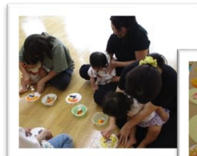
おひさまサークル