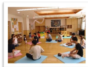
パパと一緒にタイム

兵児帯での抱っこの仕方を習いました。 コンパクトに収納できて汎用性も高いので、 防災用にもぴったり。 思ったよりしっかりと固定されるので、 参加されたママは驚いていました。 わらべ歌や助産師さんとの トークタイムもあります。