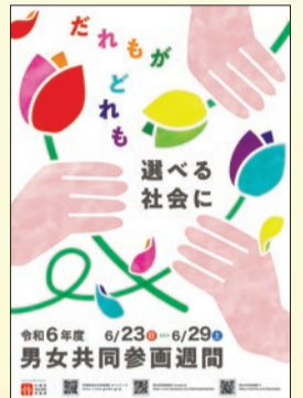
令和6年度内閣府ポスター