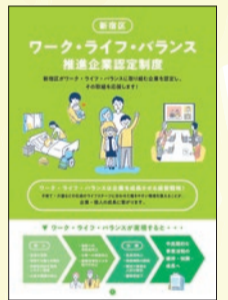
認定制度パンフレット

男性の育児・介護休業の取得や育児・介護のための短時間勤務を推進している区内の中小企業で要件を満たす場合、30万円を上限に奨励金を支給します。