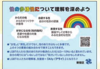
啓発カード入りティッシュ