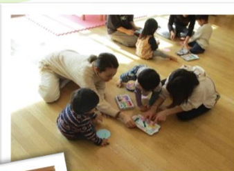
1・2歳児タイム 手作りタンパリンを作って、音遊び♪ 上手にできた☆と何回も見せに来てくれ