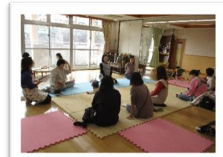
保育園学習会 保育園にお子さんを通わせている先輩ママに、保育園生活のあれこれを聞きました！ 病気になったらどうする？帰宅後のタイムスケジュールは？ 会が終わった後も、保育園トークに花が咲いていました♪