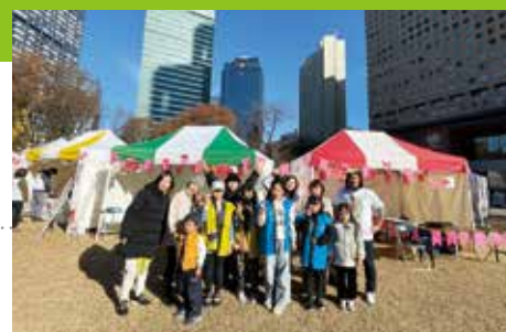
西新宿小学校PTAと共同出展した「新宿SDGsフェス」(2023年12月23日)