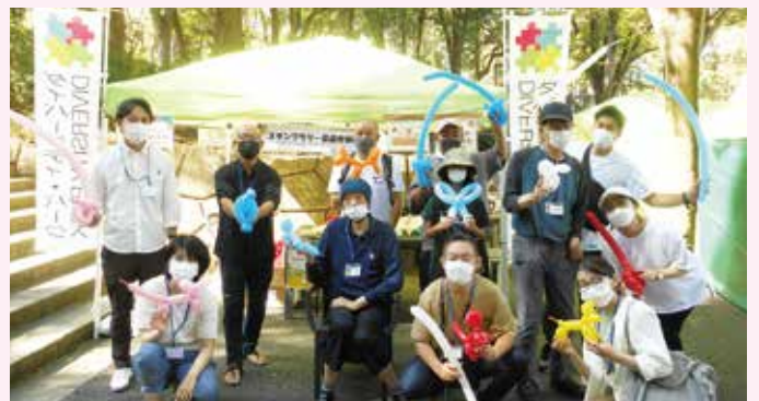
ダイバーシティ・パークin新宿