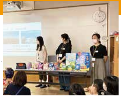
新宿CSRネットワーク主催「新宿養護学校交流会」に参加し、会社や商品の紹介を通して児童との交流を図る(2023年7月)

また、社会貢献活動として、国連WFP(食糧支援機関)のレッドカップキャンペーン(学校給食支援活動)や、Save the Children Japanと協力して実施中の「キャンディスマイルプロジェクト」では、対象商品の売上げの一部を寄付する活動を行っています。