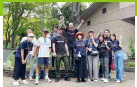
WORLD CLEANUP DAYに参加し、新宿中央公園でゴミ拾い(2023年9月11日)