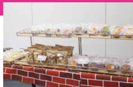
新宿福祉作業所のパン販売会を実施