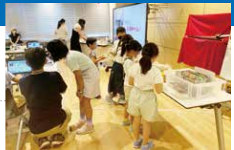
次世代を担う子どもたちのデジタル技術活用力を高める支援活動として、小学生のためのIT工作マイコンプログラミング講座を実施。