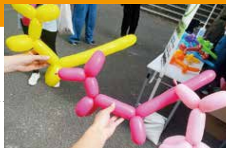
「ダイバーシティ・パークin新宿2023」にボランティア参加して作成したスタンプラリー景品のバルーンアート