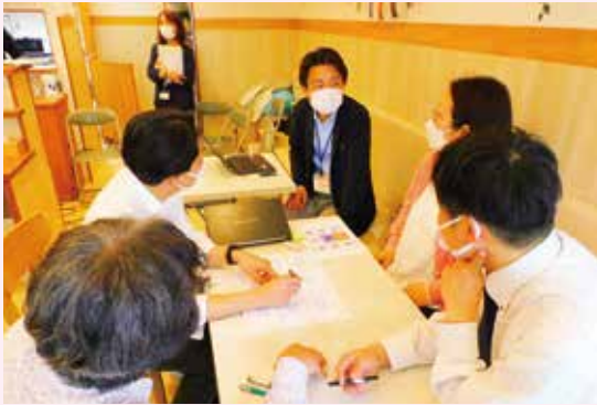
社会福祉法人サン「サンの家」にて定例会を開催

主な活動は定例会の開催、地域イベントやボランティア活動への参加、特別支援学校や社会福祉法