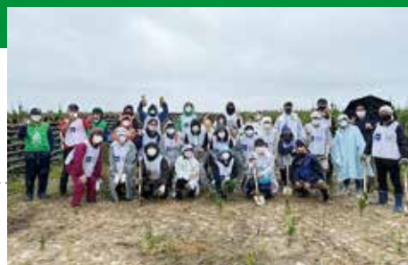
被災地復興支援で、わたりグリーンベルトプロジェクト(宮城県亘理町)に参加