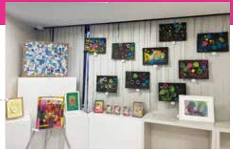
事業者内のスペースを活用し、第2回新宿アールブリュット企業展に参加(2023年12月)