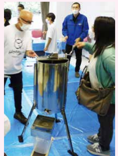
区立障害者福祉センターで、障害者の方のはちみつ採取作業を見学

人施設との交流やセミナーへの参加など、多岐にわたります。このうち、3カ月ごとの定例会では2社の幹事会社を中心に情報交換や研修などを行い、CSRへの理解を深める学びの場、地域資源や地域課題を探る場となっています。