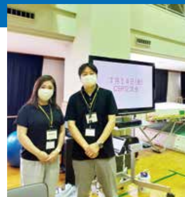
新宿養護学校交流会にて