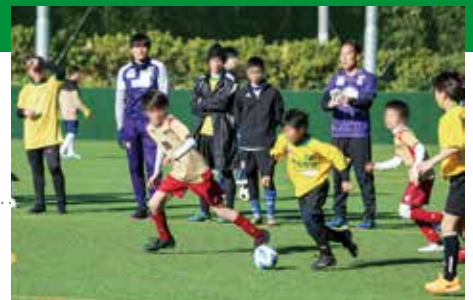
西戸山公園野球場で「新宿グローバルカップ」を開催。ベトナム、ネパール、ブラジル、中国、日本チームが参加(2023年12月23日)

令和元(2019)年から一般社団法人新宿区サッカー協会主催のフットサル大会「新宿グローバルカップ」(新宿区後援)の運営に協力し、令和2(2020)年には新宿区との間で「地域社会の発展」「スポーツの振興」「多文化共生の推進」等のための包括連携協定を締結するなど、世界一競技人口の多いサッカーを通じてCSRの可能性を広げています。