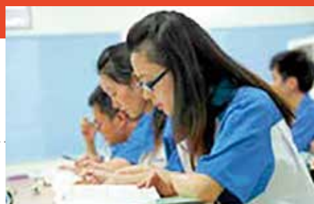
多様な人材が個々の能力を最大限発揮できる企業風土づくりを実現