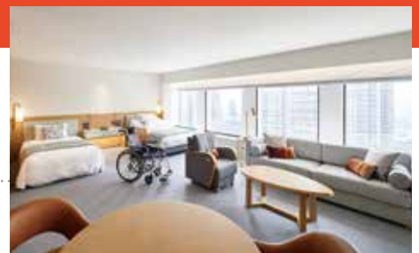
公益財団法人日本環境協会(JEA)の「エコマーク」を取得したホテル・旅館はまだ32施設のみ(2024年1月25日現在)

また、年に約43万本も使用するストローを紙製に、さらに生分解性バイオプラスチックストローに移行する取り組みなどが評価され、令和4(2022)年にエコマーク「ホテル・旅館」に認定されました。高齢者や障害者への理解を深め、持続可能な社会の創造に貢献する姿勢が「広場」をより魅力的なものにしています。